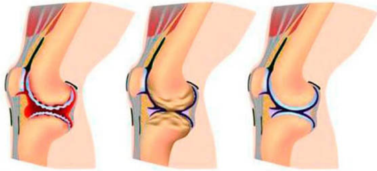
โรคข้ออักเสบ โรคข้ออักเสบ สุขภาพร่วมกัน